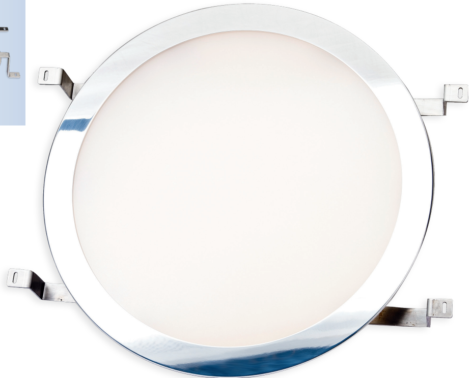
Abb.: LED-Deckenleuchte 143 566_15 mit Blendrahmen