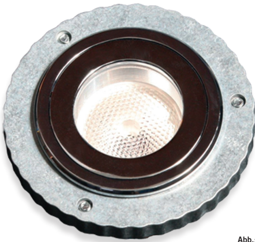
Abb.: Spot P 08 6071 LED mit Diaphragma