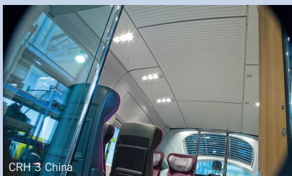
CRH 3 China