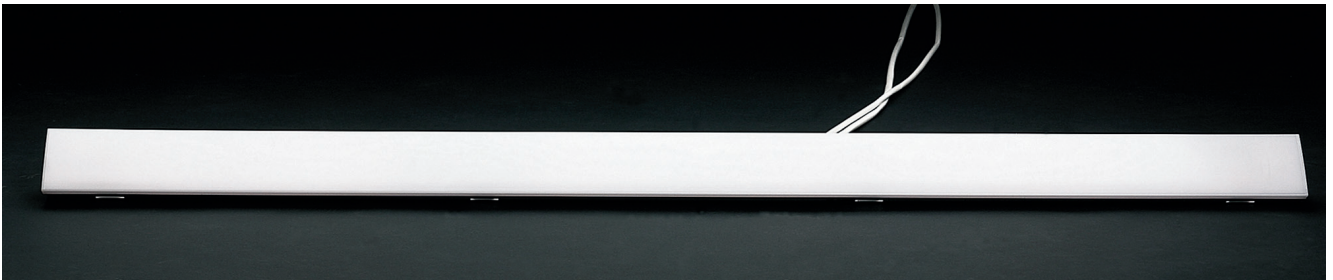
Abb.: Decken-Einbauleuchte 143 380 Ansicht von vorn