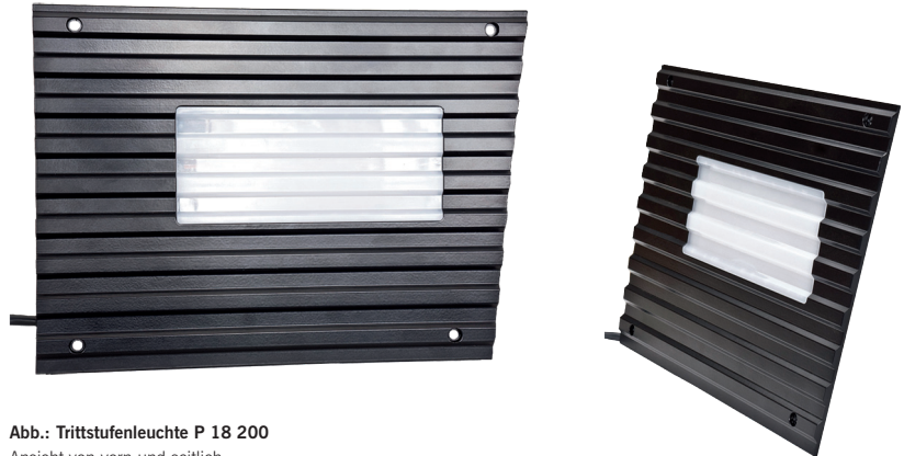
Abb.: Trittstufenleuchte P 18 200 Ansicht von vorn und seitlich

An der Frontseite der Trittstufenleuchte befindet sich eine pulverbeschichtete Aluminiumblende mit eingesetzter Polycarbonat-Abdeckscheibe. Rückseitig ist das beschichtete Gehäuse mit Nutblechen fest verschraubt. Hier sind die komplette Verdrahtung sowie das Leuchtmittel integriert.